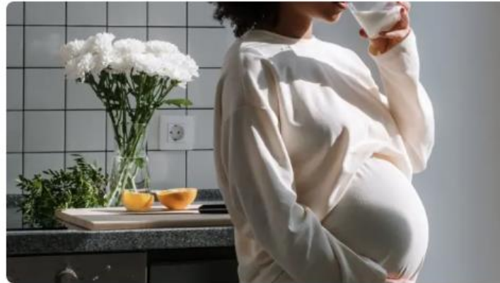
Qué son las pruebas de reserva ovárica

La edad media para ser madre por primera vez en España ha aumentado cinco años desde 1975. El hecho de retrasar la maternidad por razones sociales, económicas o por elección personal podría suponer no solo un riesgo mayor durante la gestación , también una menor probabilidad de embarazado.